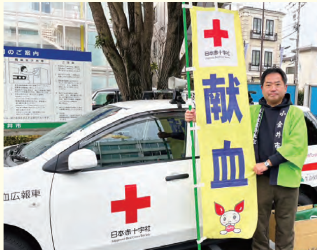
献血推進協議会の事務局長として市役所前で献血ご協力をお願いかける。この日の朝、北陸地方は今季一番の冷え込みだった...。被災された方々に心よりお見舞い申し上げます。(1月11日)