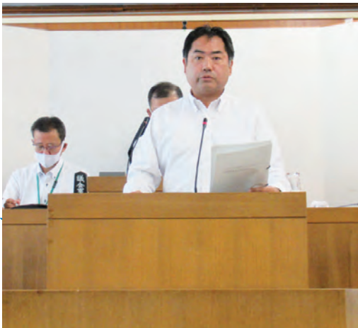
庁舎等建設及び公共施設マネジメント推進調査特別委員会の委員長として本会議場で委員長報告。約2年間も中断していた事業が再び動き出す。(9月25日)

9月13日の市議会全員協議会にて新庁舎等建設事業の検証作業の結果と再開について説明、質疑がありました。